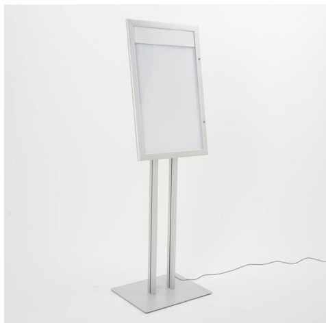
Tableau d'affichage porte-menu avec éclairage LED h738_30

Élégant tableau d'affichage porte-menu à LED sur pied (hauteur 163 cm) pour format 4xA4. Structure en acier avec fond magnétique inscriptible, porte en polycarbonate et double serrure. Idéal pour l'extérieur des bars et restaurants, avec panneau supérieur personnalisable.