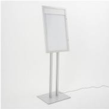
Tableau d'affichage porte-menu avec éclairage LED h738_30