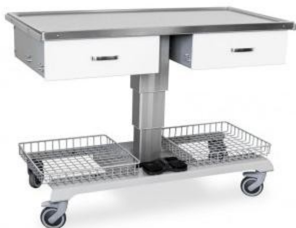
Table vétérinaire avec tiroirs h930_36