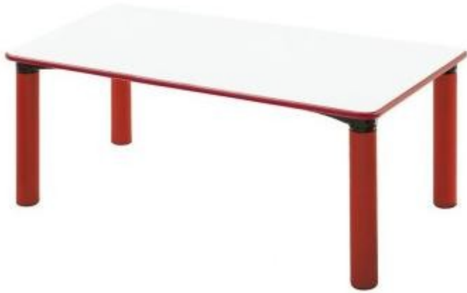
Table pour école maternelle h735_03