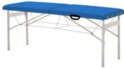
Table d'examen valise pour visites médicales h731_82