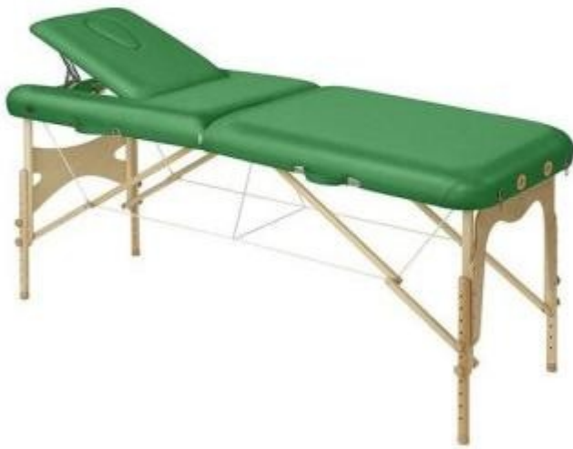
Table d'examen portable en bois h. réglable h904_36