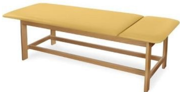
Table d'examen ou de massage en bois h930_46