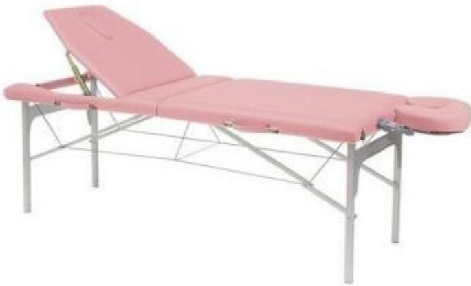
Table d'examen médicale portable en aluminium h. réglable h904_37