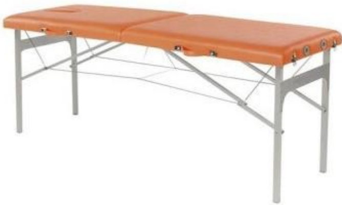
Table d'examen médicale portable en aluminium à hauteur fixe h904_38