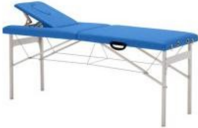
Table d'examen médicale pliante h731_83