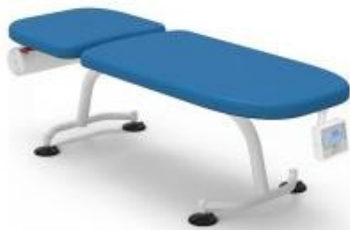
Table d'examen médical avec pèse-personne h634_14