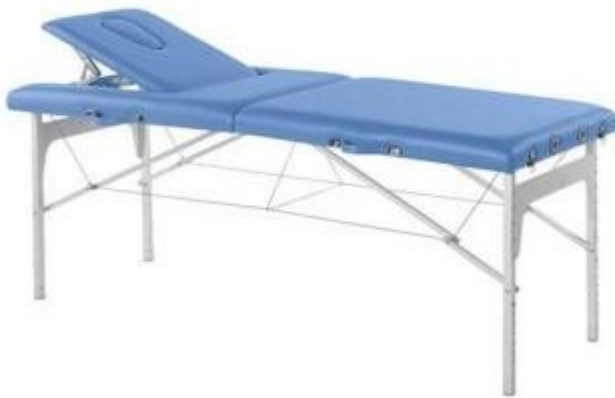
Table d'examen médical à hauteur réglable h904_31