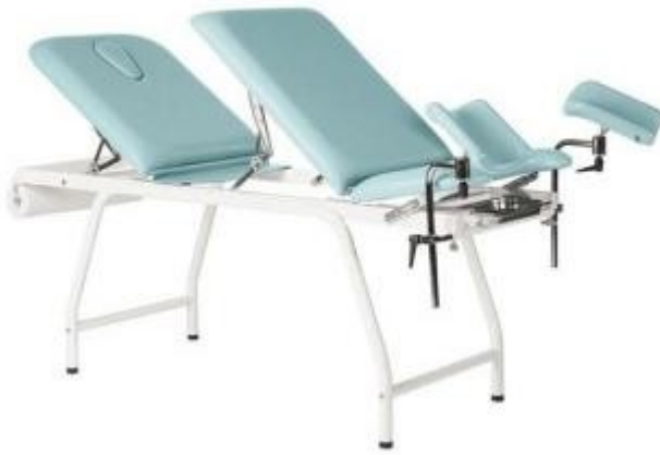
Table d'examen gynécologique à hauteur fixe h904_41