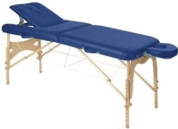
Table d'examen et de massage h. réglable h904_35