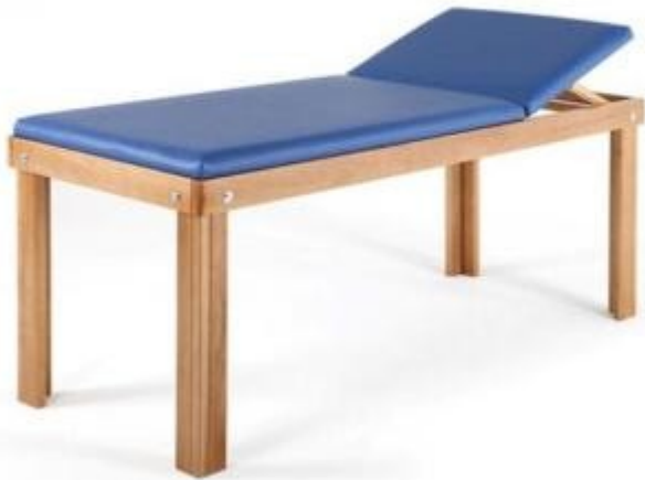
Table d'examen en bois h583_18