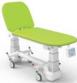
Table d'examen avec balance h634_16