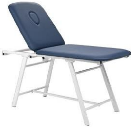
Table d'examen 2 sections avec dossier réglable +80° h725_27