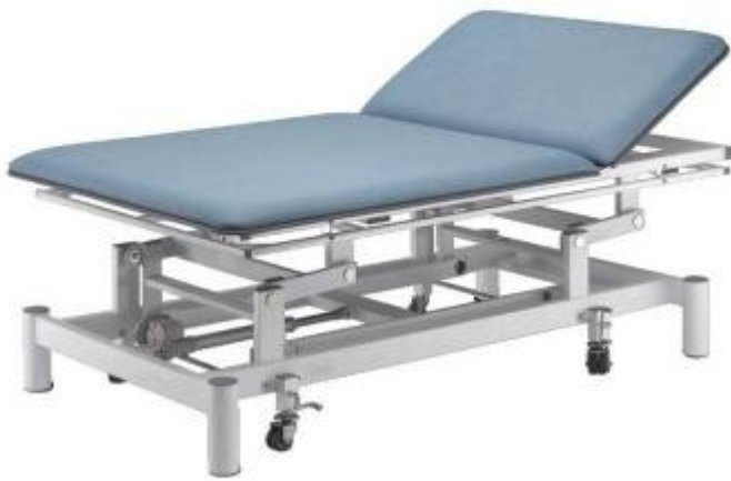
Table de traitement professionnelle pour Bobath et Vojta h725_23