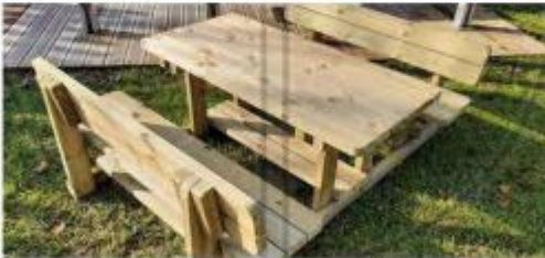
Table de pique-nique et bancs avec dossier pour enfants h773_27