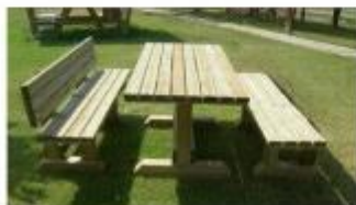
Table de pique-nique avec 2 bancs dont un avec dossier h773_25