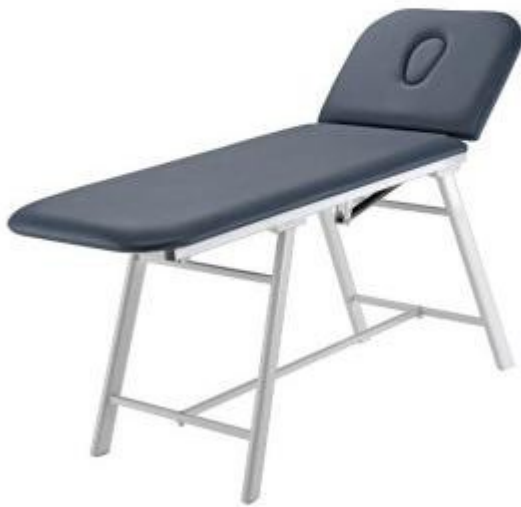
Table de massage et d'examen à hauteur fixe avec tête réglable h725_28