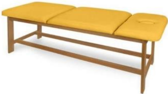
Table de massage en bois à 3 sections h930_47