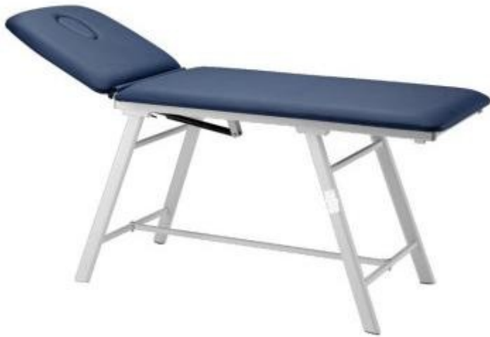
Table de massage 2 sections avec dossier réglable h725_26