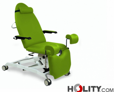
Table de gynécologie électrique h728_04

Table de gynécologie professionnelle à 2 moteurs, structure en acier et revêtement en vinyle ignifuge 11M. Réglage électrique de la hauteur et de l'inclinaison.