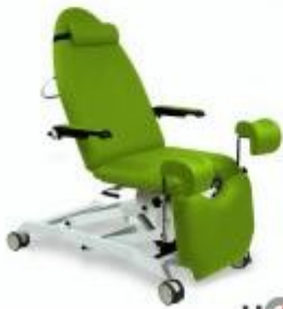
Table de gynécologie électrique h728_04