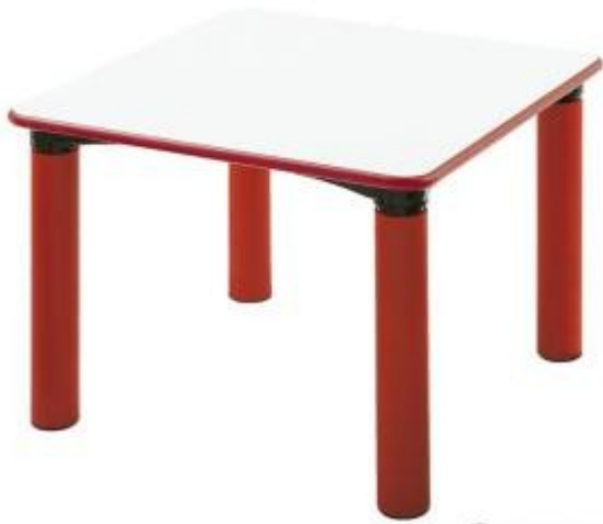
Table carrée pour école maternelle h735_02