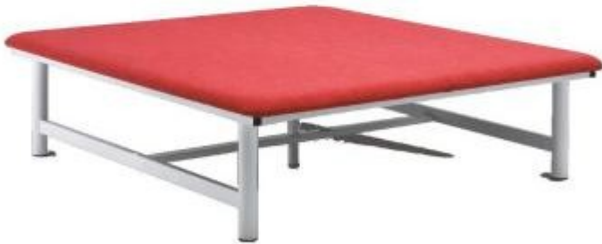
Table Bobath 200x200 cm à h. fixe h725_25