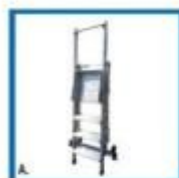
A. Scala chiusa