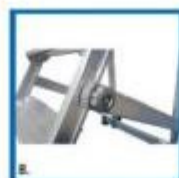
B. Volantino di chiusura scaia