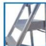
C. Dettaglio pianerottolo