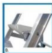
D. Dettaglio gradini