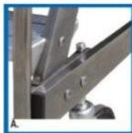
Particolare attacco gradino