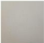
Grigio luce raggrinzato RAL 7035