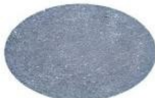
Tipo Pietra Lavica