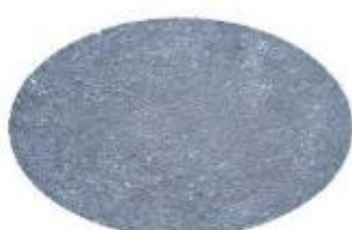
Tipo Pietra Lavica